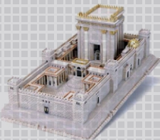
Templo de Salomão

O primeiro templo de Jerusalém foi construído pelo Rei Salomão, como conta 2 Crônicas a partir do capítulo 1. Essa construção foi destruída por Nabucodonosor no ano 586 antes de Cristo, ocasião em que o povo de Israel foi levado como prisioneiro para a Babilônia.