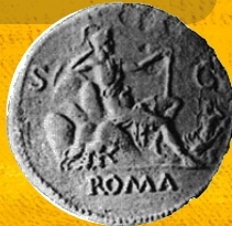
MULHER SENTADA SOBRE 7 MONTES