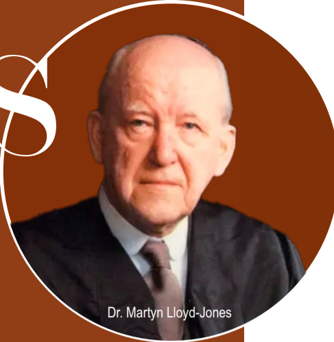
Dr. Martyn Lloyd-Jones